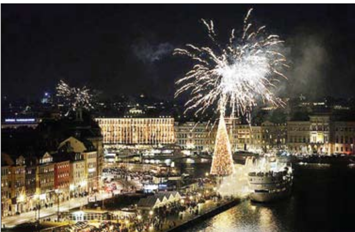
آتش بازی سال ۲۰۱۷ در استکهلم سوئد