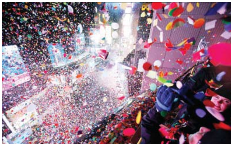
جشن سال نو در میدان تایمز نیویورک