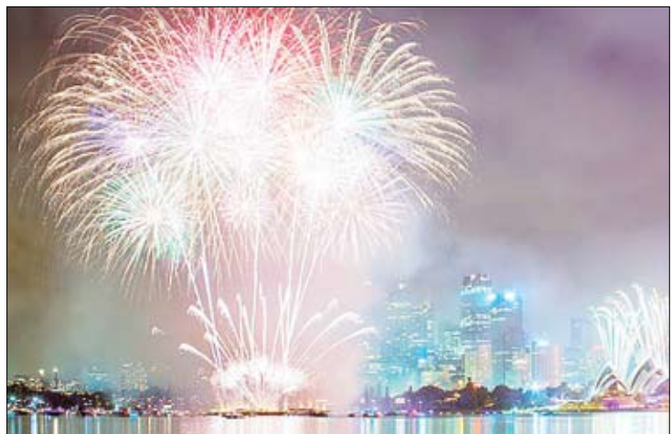
آغاز سال نو در سیدنی استرالیا