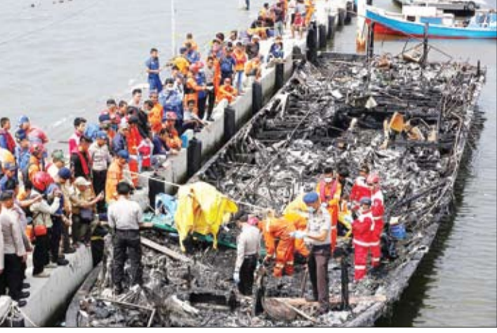
۲۳ کشته و ۱۷ زخمی در آتش سوزی سوزی یک کشتی مسافربری در جاکارتا - رویترز

اگر حساب پول های خود را نداشته باشید نگاه نخواهید توانست یک میلیون دلار داشته باشید.