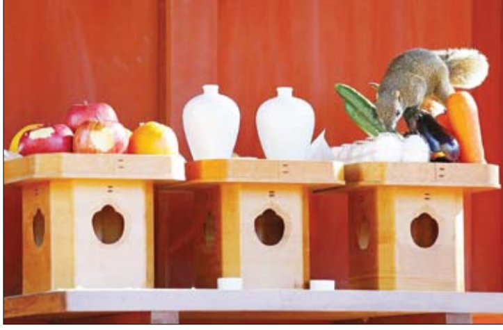
سنجابی در حال خوردن غذاهای اهدایی به معبد چهارچامانگو زاین