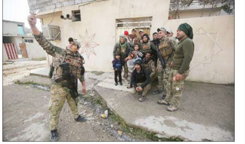
نیروهای عراقی در حال عکس گرفتن از یکی از مناطق آزاد شده از دست داعش