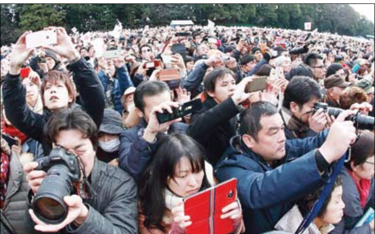
مردم زابن در انتظار امیراتور اکتیو – Rex