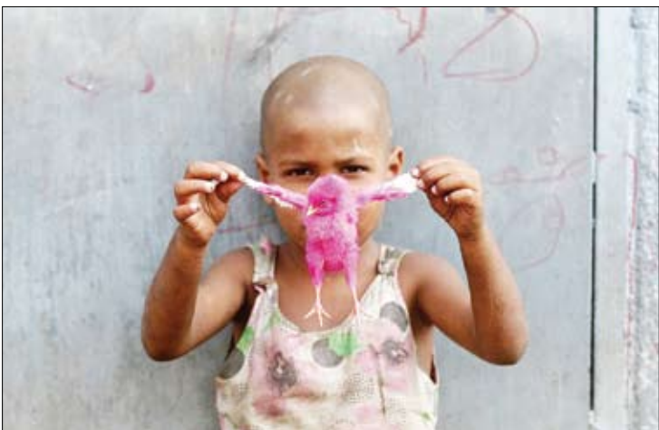
بازی با جوجه رنگی در زاغه نشین‌های بمبئی