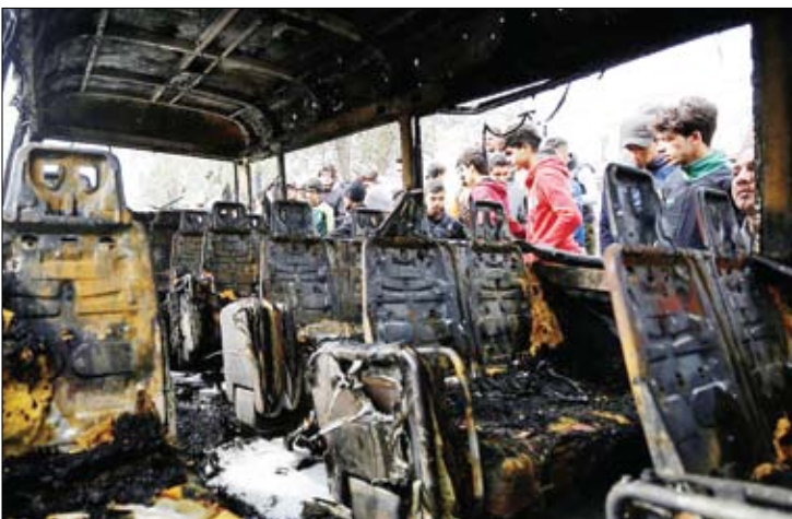
خودروی آتش گرفته پس از بمبگذاری داعش در بغداد – رویترز