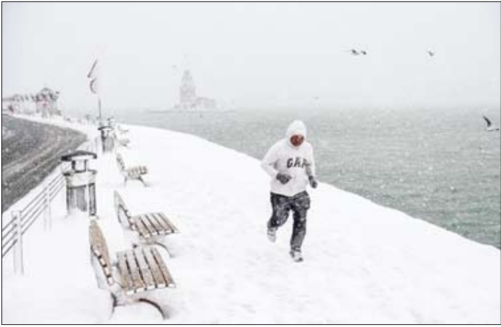
موج سرما در ترکیه

به من نگو اولویت های زندگی تو کیاست، فقط بگو بولت را چگونه خرج می کنی آنگاه به تو می گویم اولویت های زندگی تو چیست. جمرب دلیوب فریگ