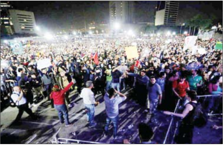
معترضان مکزیکیی به افزایش قیمت بنزین