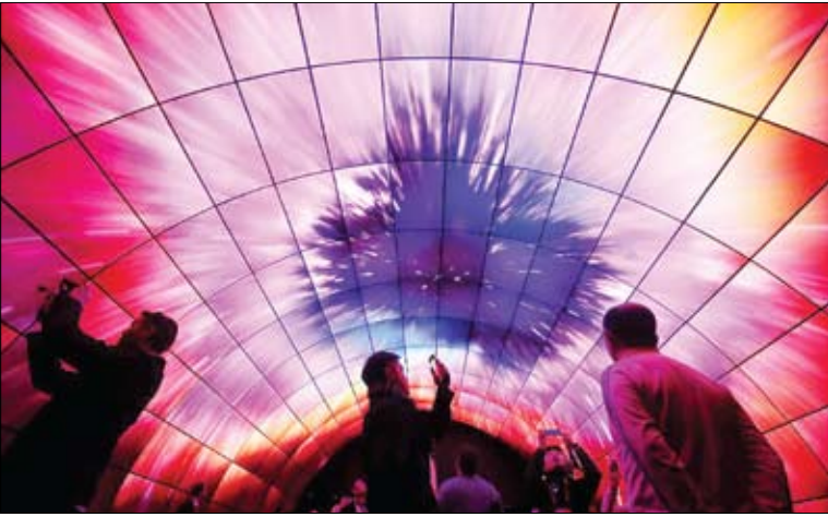
تونل تلویزیونی در آمریکا