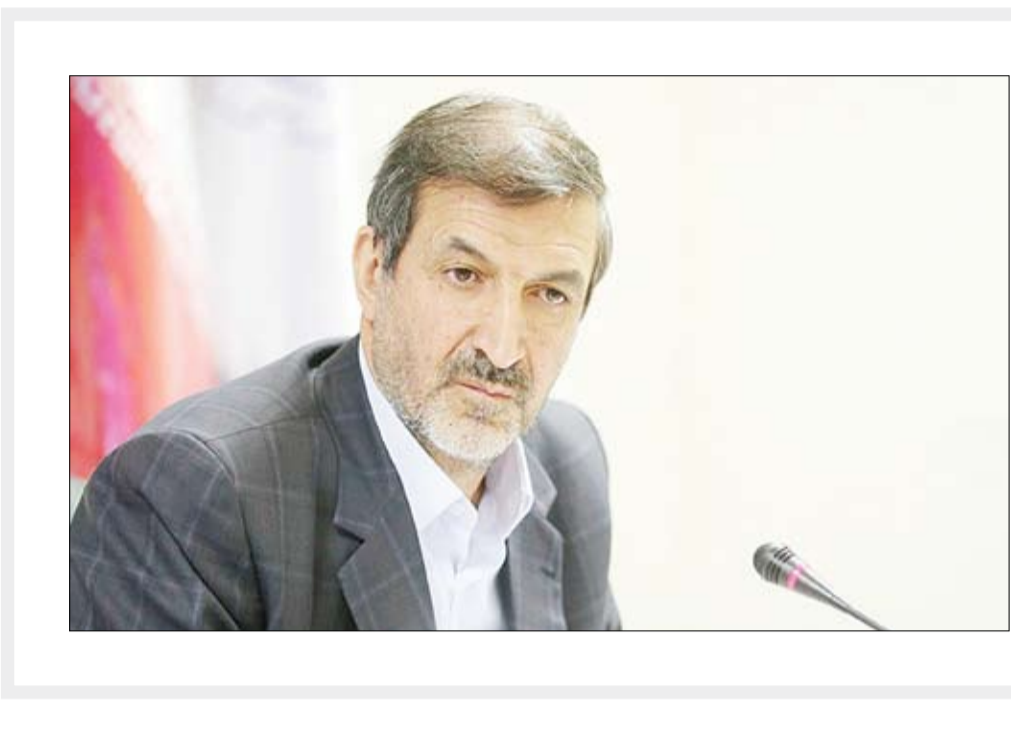
مدیرکل اداره بارورسازی ابرها در استان خراسان جنوبی.

وی ادامه داد: طبق آمار دریافتی از استان بوشهر