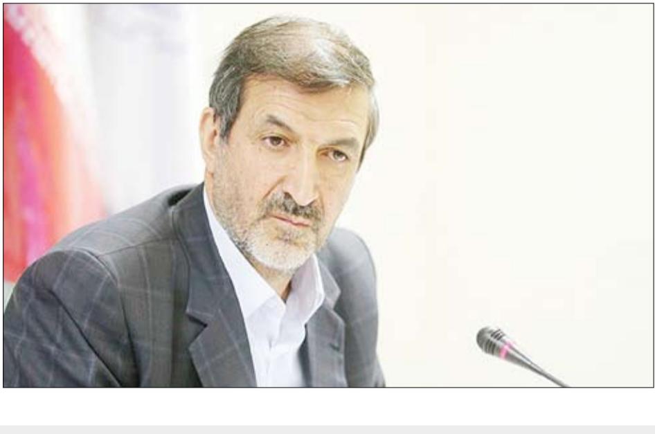
مدیرکل اداره بارورسازی ابرها در استان خراسان جنوبی.

۱۵ درصد افزایش بارندگی با طرح بارورسازی ابرها