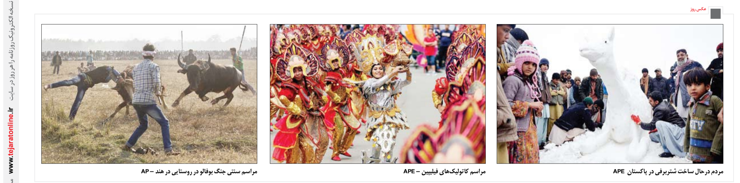
مراسم سنتی جنگ بوفالو در روستایی در هند - AP مراسم کاتولیک‌های فیلیپین - APE مردم در حال ساخت شتربری در پاکستان - APE

نسخه الکترونیک روزنامه را هر روز در سایت www.tejaratonline.ir مشاهده کنید.