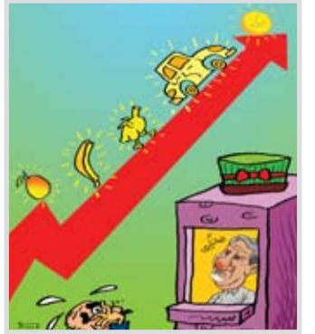
کاریکاتور امروز / صفحه ۱۲