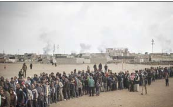
صف مردم موصل برای دریافت غذا

■ احتمال خروج آمریکا از شورای حقوق بشر سازمان ملل سیاست‌های جنجالی سنیتز ترامپ که با محکومیت بین‌المللی همراه بوده ممکن از فراتر از حرف رود و آمریکا از شوراای حقوق بشر سازمان ملل خارج شود. در صورتی که شورای حقوق بشر سازمان ملل متقاعد به اعمال اصلاحات نکند، ممکن است کشورش از این شورا خارج شود.به گزارش خبرگزاری آسوشیتد پرسیس، رئیس تیلرسون، رئیس دستگاه دیپلماسی آمریکا اعلام کرد، در حال حاضر، کشورش در جلسات شورای حقوق بشر شرکت می‌کند تا بر اعتراض قاطع خود نسبت به «ویکرلد جانبدارانه این شورا در قبال اسرائیل» تأکید کند.وزیر امور خارجه آمریکا خاطر نشان کرد: دشواری حقوق بشر سازمان ملل متحد نیازمند اصلاحات جدی و قابل ملاحظه است تا ما بتوانیم به مشارکت خود در این شورا ادامه دهیم.