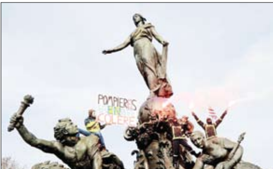
اعتراض مأمورین انتشاشتی به تعدیل نیودر پاریس