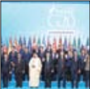
صفحه نخست روزنامه تجارت

وزرای اقتصادی ۲۰ کشور جهان روز جمعه در حالی در آلمان گرد هم می‌آیند که شمار رئیس‌جمهور جدید آمریکا منی بر «اول آمریکا» می‌تواند نظم جهانی اقتصاد را تغییر دهد.به گزارش خبرگزاری فرانسه، دونالد ترامپ، رئیس‌جمهور آمریکا طی دو ماه حضورش در کاخ سفید توافق اقتصادی ترنس پاسیفیک را لغو و تهدید کرد تعرفه‌های گمرکی برای کارخانه‌های خارج از آمریکا را افزایش می‌دهد. ضمن اینکه به صادرات چین حمله کرد.در همین حال استیون منوچن، وزیر خزانه‌داری آمریکا، اولین سفر خارجی خود را برای حضور در کشورهای گروه ۲۰ انجام می‌دهد؛ نشستی که با حضور وزرای خارجه این کشورها و بانکداران مرکزی آنها از روز جمعه در آلمان شروع به کار می‌کند.انتظار می‌رود این بانکدار سابق با شرکای تجاری کلیدی خود درگیر نشود چراکه همگی این سوال را در ذهن دارند که آیا این قول اقتصاد جهان واقعا قصد دارد تا حمایت طولانی مدت خود را بازار آزاد را کنار بگذارد. با این حال پیش از این نشست آلمان در صدد اتخاذ لحنی سازگارانه برآمد تا به نحوی بتواند از وزرای اقتصاد آلمان در این باره گفته، هیچ دلیلی وجود ندارد که درباره اقتصاد جهانی بدبین باشیم و هیچ دلیلی هم وجود ندارد تا درباره روابط با آمریکا بدبین باشیم. مساله دیگری که ذهن کشورهای گروه ۲۰ را به خود درگیر کرده این سوال است که آمریکا به اعتقاد خود به گروه ۲۰ ادامه خواهد داد.