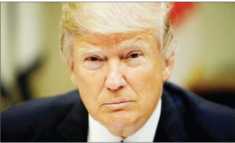
صفحه نخست روزنامه تجارت

مدارکی که حاوی اعداد و ارقام باشد منتشر نکرده‌ا ما گفته که دونالد ترامپ به عنوان مدیر سازمان ترامپ، بیش از آنچه وظیفه قانونی‌اش بوده، نباید رقمی می‌برداخته است.دونالد ترامپ بر خلاف روسای جمهوری پیشین آمریکادر چهار دهه گذشته از انتشار اظهارنامه مالیاتی خود سر باز زده‌است.دو هفته مانده به انتخابات ریاست جمهوری آمریکاروزنامه نیویورک تایمز گزارش داد، اسنادی از سابقه مالیاتی ترامپ به دستش رسیده‌است که نسبت به سایر گزیندها از شانس بیشتری برخوردار است.اما گمانه زنی‌ها حکایت از آن دارند که با توجه به بهبود نسبی بازار کار و نرخ تورم، مسئولان بانک مرکزی آمریکا در نظر ندارند این سیاست را برای مدت طولانی ادامه دهند. این در حالیست که کاهش بیش از انتظار میزان فروش خرده فروشان آمریکا در ماه فوریه، موجب بروز نگرانی‌هایی در مورد چشم‌انداز رشد اقتصادی این کشور شده‌است؛ عاملی که بدون شک از چشمان تیزبین سیاست‌گذاران بانک مرکزی آمریکا پنهان نخواهد ماند.