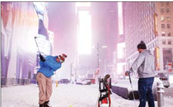
گلف بازی در میدان بر فی مدیسون اسکوتر نیویورک