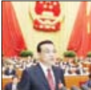
صفحه نخست روزنامه تجارت

کنگره سالانه چین با تاکید بر لزوم رشد اقتصادی این کشور به کار خود پایان داد.اقتصاد چین در سال ۲۰۱۶ میلادی و برای نخستین بار طی ۲۶ سال گذشته کندتر رشد را تجربه کرد. با این وجود نخست‌وزیر این کشور در جمع سه هزار شرکت کننده در این نشست سالانه برای چین رشد اقتصادی هفت درصدی را پیش بینی کرد و اعلام کرد که دولت اجازه نخواهد داد این رقم به کمتر شش و نیم درصد برسد.لی کیچی بانگ، نخست‌وزیر چین ضمن اظهار امیدواری به ادامه رابطه اقتصادی چین و ایالات متحده در دولت ترامپ گفت: «رئیس جمهوری ترامپ و مسئولان بلند رتبه از کابینه جدید آمریکا به صراحت اعلام کردند که ایالت متحده همچنان پیرو سیاست چین و احد است. این موضوع شکل دهنده پایه و اساس رابطه سیاسی میان چین و آمریکا است. رابطه‌ای که من متزلزل می‌شود و نه می‌تواند با وجود تغییرات تحت تأثیر قرار گیرد. بر این مبنا ما چشم‌انداز روشنی برای همکاری میان دو کشور می‌بینیم.» نخست‌وزیر چین اعلام کرد جنگ تجاری با آمریکا، تجارت ما را بهتر نخواهد کرد.لی کیچی بانگ در این نشست همچنین به صراحت از مخالفت خود با استقلال تایلاند خبر داد و براصل وجود چین و چین واحد تاکید کرد.وی گفت که ما هرگز هیچ گونه ای فعالیتی به هر شکل ممکن را برای جدایی تایلوان از سرزمین مادری تحمل نخواهیم کرد.