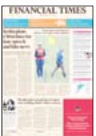
صفحه نخست روزنامه تجارت

در مورد توئیتر مثل گذشته تنها یک توییت از صد توییتی که به عنوان نفرت‌پراکن گزارش شده از این شبکه پاک شده‌است. هیچ‌کدام از توییت‌ها در عرض ۲۴ ساعت پاک نشده‌اند. تویتوب ۹۰ درصد ویدئوهای قابل مجازات را از وبسایت خود محو کرده است. ۸۲ درصد این ویدئوها در عرض ۲۴ ساعت پس از شکایتی که در رابطه با آنها صورت گرفته از صفحه خارج شده‌اند.