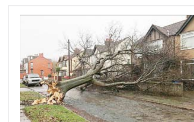
سقوط درخت بر اثر طوفان شدید در انگلیس

یک حمله انتحاری با دست کم ۲۹ قربانی؛ حمله‌ای در نزدیکی شهر البباب، واقع در شمال سوریه، یک روز پس از آنکه خبر تصرف الباب اعلام شده بود. خبری که در واقع، به معنی عقب نشینی نیروهای داعش از این شهر بود. به گزارش خبرگزاری فرانسه از بیروت دیروز در اثر یک حمله انتحاری در نزدیکی شهر البباب، دست کم ۲۹ نفر کشته شده‌اند. گفته می‌شود که اکثر قربانیان این حمله، زندگانی بوده‌اند که با حمایت و پشتیبانی ترکیه علیه نیروهای داعش می‌جنگیدند. خبر این حمله انتحاری در حوالی شهر البباب زمانی منتشر می‌شود که روز ۲۳ فوریه، شورشیان از عقب راندن نیروهای داعش از این شهر خبر داده بودند. بر اساس خبر فرانس پرس، یک مهاجم انتحاری با منفجر کردن خودروی خود در "سوسیان" منجر به کشته شدن شماری از شورشیان شده است. سوسیان در شمال شرقی شهر البباب واقع است. وضعیت حاکم بر شهر البباب هنوز کاملاً روشن نیست.