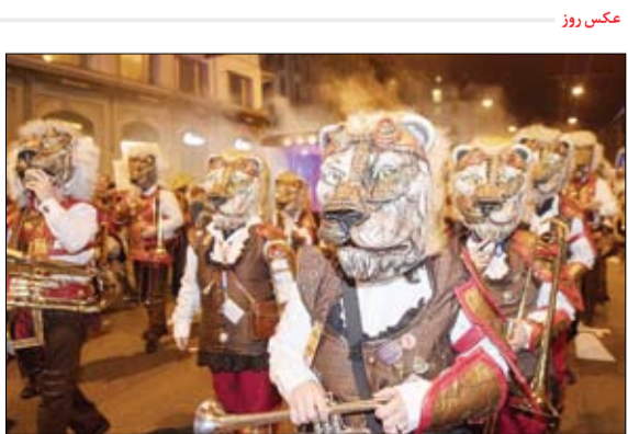
کارناوال سنتی در لوسرن سوئیس