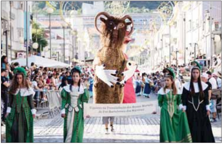
برگزاری یکی از قدیمی ترین فستیوال‌های بریتال

نسخه الکترونیک روزنامه را هر روز در سایت www.tejaratonline.ir مشاهده کنید.