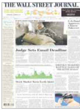
THE WALL STREET JOURNAL

شاخص معاملات بورس به طور قابل توجهی آرام بوده است که به دلیل انتظار از دیدار آتی جانت بلین ریاست فدرال رزرو با روسای بانک‌های جهانی است. به گزارش تجارت آنلاین به نقل از وال استریت ژورنال، انتظار می‌رود فدرال رزرو بار دیگر نرخ بهره‌های بانکی را افزایش دهد و معاملات بورس به ۰٫۰ درصد رسیده است که حاکی از تامل سرمایه‌گذاران است. بازارها به ندرت رویکرد آرام دارند اما شاخص S&P در سطحی پایین قرار دارد. پیشتر رای همه پرس‌های خروج انگلیس از اتحادیه اروپا باعث شوک به سرمایه‌گذاران شد. وال استریت مدت زمان زیادی بر عملکرد فدرال رزرو گذاشته است. هنوز مشخص نیست که بانک‌های مرکزی تا چه حد با سیاست‌گذارهای خود به بازارها صدمه خواهند زد. اما خانم بلین گفته است که ارزش دلار کمتر از سطح مورد انتظار کاهش خواهد داشت. در حال حاضر سرمایه‌گذاران به نظر می‌رسد که به حد کافی سرمایه در دست دارند. خطر درباره رضایت از بازارهای نیست بلکه رضایت از بانک‌های مرکزی مطرح است. سیاست‌گذاران مالی در سال‌های گذشته باعث لرزش در بازار شدند ولی سرمایه‌گذاران همواره موسسه شدند تا به بانک‌های مرکزی تکیه کنند.