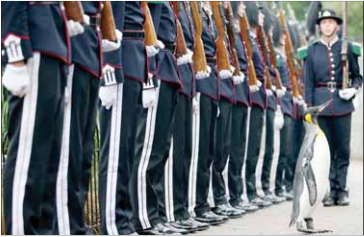
حضور یک پنگون در گرد نظامی ادینبور