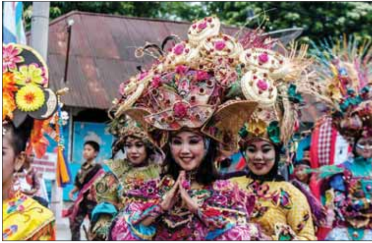
شرکت کنندگان در جشن استقلال اندونزی