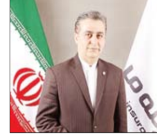
مدیر عامل بیمه "ما":