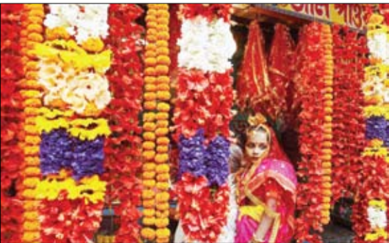
دختری در مراسم هونها در کلکته

از ژاپن گرفته تا کشورهای آسیای جنوب شرقی و شمال شرق و همچنین چین، تلاش می‌شود تا همه به دنبال تحت فشار قرار دادن کره شمالی باشند.