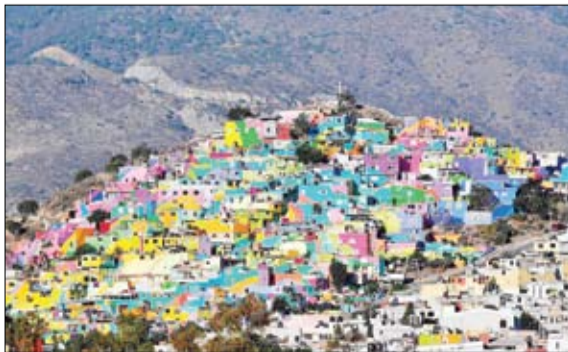
خانه‌های رنگی مکزیکي در باجوآ