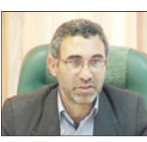
تومان اعتبار از محل

تومان اعتبار از محل اعتبارات وزارت راه و شهرسازی (شرکت) صادر تخصصی عمران و پیسسازی و شهرسازی است.