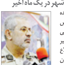
تجارت -استان پوشهر: فرمانده

دریایانی استان پوشهر از افزایش ۲۲ درصدی کشفیات دریایانی استان پوشهر در یک ماه اخیر خبر داد.به گزارش پایگاه اطلاع رسانی فرمانده دریایانی استان پوشهر، سرهنگ پاسدار “...و...” رضایی‌نژاد “فرمانده دریایانی استان پوشهر از آمار یک ماه گذشته در این استان خبر داد و گفت: آنچه که برای دریایانی از اهمیت به نسایی برخوردار است، بستن ورودی کشور و مبارزه با قاچاق کلان و سازمان یافته می‌باشد. پرونده‌های قاچاق در یک ماهه گذشته (آذرماه)نسبت به مدت مشابه سال گذشته، نزدیک به ۲۲ درصد افزایش داشته است.وی در این رابطه تصریح کرد: در طی این مدت اخیر، پوشاک، لوازم آرایشی بهداشتی، دارو، موبایل، تبلت، فرآورده‌های شیمیائی، پتئو، لوازم التحریر، اسباب‌بازی، لوازم یدکی خودرو، آلات عکاسی و سینمایی، لوازم جانبی رایانه، اقلام مخفباتی، ادوات و ابزار آلات صیادی و صدها قلم کالای قاچاق دستگیری ۱۶ متهم در این رابطه، گفت: توقیف ۲۶ شناور متخلف و توقیف ۱۱ خودرو، از دیگر اقدامات دریایانان استان پوشهر طی یک‌ماهه گذشته بوده‌است. سرهنگ پاسدار رضایی‌نژاد در خاتمه‌ای اشاره به ارزش ۲۰۳ میلیارد و ۹۰۱ میلیون ریالی کشفیات گذشته خاطر نشان کرد: دریایانان این استان شبانه‌روز و در سخت‌ترین شرایط جوی برای کشف، حراست از مرزها تلاش می‌کنند و تمام توان را بجایگزین به خاک کشورمان جلوگیری خواهند کرد و همچنین از همکاری بی‌وقفه مردم دلوس و قنبردان این استان با دریایانی تقدیر و تشکر ویژه می‌کنم.