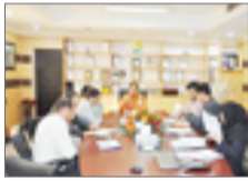
مدیر عامل شرکت گاز استان ایلام بر اولویت گازرسانی به صنایع استان تأکید نموده.