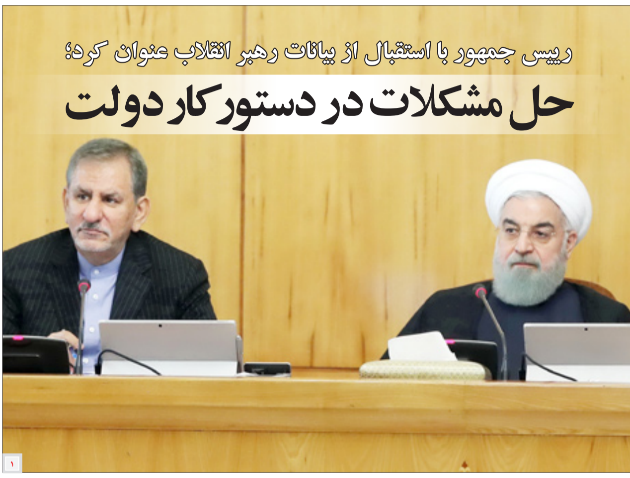
محمدجواد ظریف تاکید کرد؛