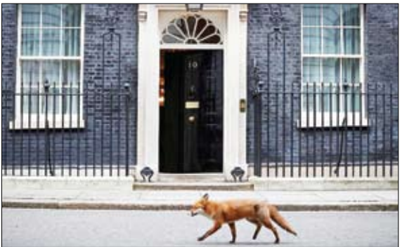
عبور روباه از کنار درب خانه نخست‌وزیر انگلیس