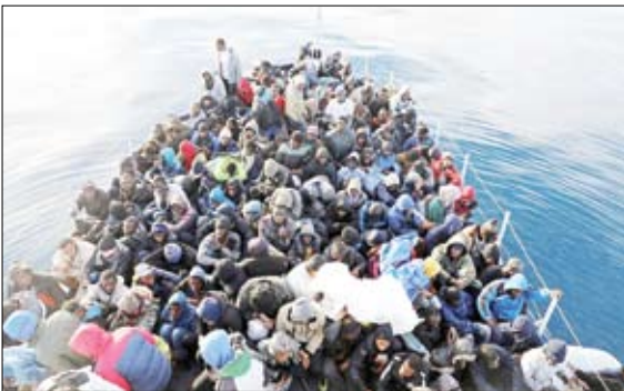
مهاجران در قایق نجات گاردلیبی - رویترز