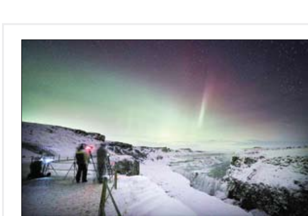
عکاسی از شفق قطبی در کنار ایشار گلفوس ایسلند