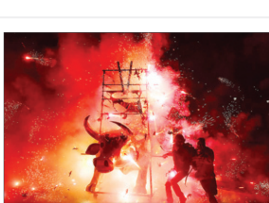
آتش بازی در مکزیک