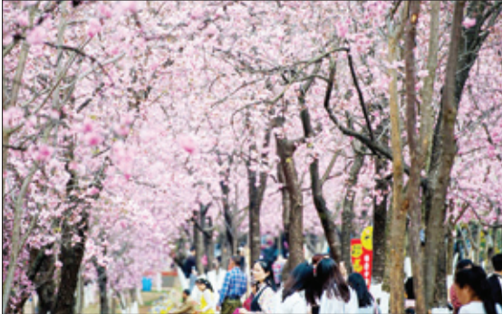
شکوفه‌های گلیس در بانتونگشان بارک چین-سینپو