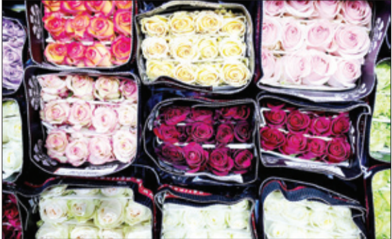
بازار گل در مسکو