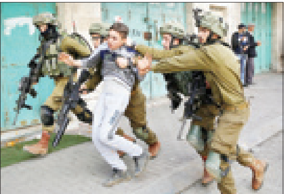
بازداشت نوجوان فلسطینی توسط سربازان اسرائیل در اعتراض به شهرک‌سازی

مذاکرات اعضای شورای امنیت در روز جمعه درباره پیش‌نویس قطعنامه آتش بس ۳۰ روزه در غوطه شرقی به نتیجه نرسید و رای‌گیری درباره این پیش‌نویس به شنبه تعویق افتاد. «منصور ایاد العتیبی» سفیر کویت در سازمان ملل متحد و رئیس دوره‌ای شورای امنیت گفته است، پیش‌نویس برای پایان دادن به کشتار در غوطه شرقی و دیگر مناطق سوریه شنبه به رای گذاشته شد. پیش‌نویس این قطعنامه پیش‌بینی کرده است که ۲۲ ساعت پس از تصویب قطعنامه، باید در غوطه شرقی آتش بس برقرار شود و ۴۸ ساعت پس از آن هم اجازه تحویل کمک‌ها و خروج از منطقه برای دریافت خدمات پزشکی داده شود.