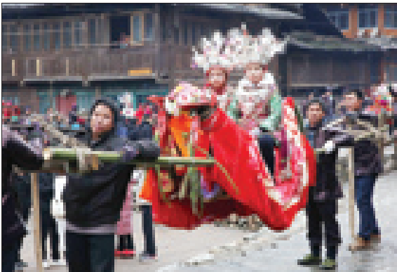
کودکان درفستپول تاگلانرن برای داشتن هوایی خوب در سال جدید دعا می‌کنند