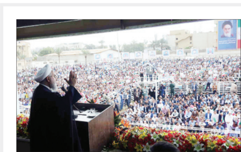
روحانی با اشاره به برخی از مطالبات مردم استان هرمزگان در ادامه

هرمزگان استان انرژی؛ فولاد و گردشگری است