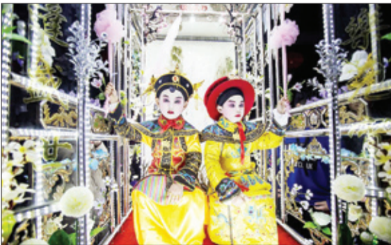
شرکت کنندگان در رژه سالانه شیشوال نوس در استان ژانگ‌جین