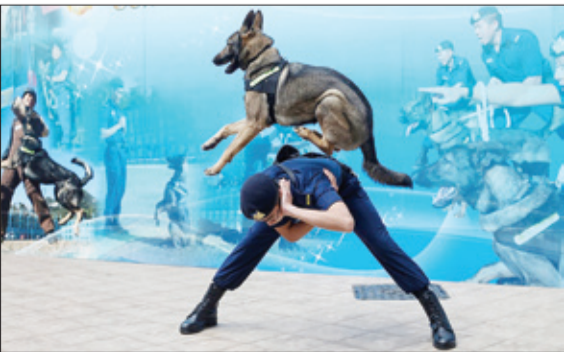
تمرین واحد سگهای پلیس زندان در هنگ کنگ

در واکنش به سخنان پاول، بازارهای سهام در اروپا ووال استریت به منطقه فرمز (ضرردهی) وارد شدند و شاخص‌های داو، اس‌اندپی و نزدک هر کدام بیش از ۱ درصدسقوط کردند. قیمت اوراق خزانه‌داری کاهش یافت و سود ۱۰ ساله آنها دوباره از ۲.۹درصدفراتر رفت.در بازار دلار در برابر اکثر ارزهای مهم جهان تقویت شد و در برابر دلار استرالیا به بالاترین میزان ۱ و نیم ماهه خود رسید. در برابر یورو دلار، به بالاترین میزان ۳هفته‌ای خود رسید و در نرخ ۱.۲۲۲۷ دلار به ازای هر یورو معامله شد