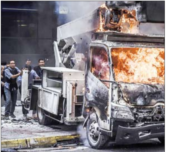
کارمندان دیوان عالی ونزوئلا در میان معترضین به دولت نیکولا مادورو