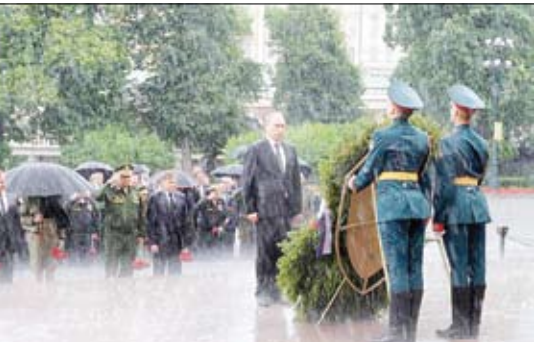
توتین در مراسم یادمان مقاومت سربازان روسیه در حمله المان

بوده است. ایران همچنین گفته است که بر اساس ملاحظات بشردوستانه، مقادیری مواد غذایی به قطر ارسال داشته و از آمادگی خود برای کمک به کاهش فشار ناشی از تحریم بر مردم قطر سخن گفته است. این فهرست را کویت که در جریان مناقشه اخیر، نقش میانجی را ایفا می‌کند، تسلیم دولت قطر کرده است. این در حالی است که روز چهارشنبه هنر نوئرت سختگویی وزارت خارجه امریکا نسبت به انگیزه تحریم قطر توسط کشورهای عرب ابراز تردید کرد. او از جمله گفت: «با آنکه دو هفته از آغاز این تحریم‌ها می‌گذرد اما کشورهای حوزه خلیج فارس هنوز در مورد ادعاهای مطرح شده علیه قطر جزئیات مشخصی در این مورد در اختیار افکار عمومی نگذاشته‌اند و با گذشت زمان تردیدی بیشتری در این مورد به چشم می‌خورد.» قطر هرگونه حمایت از تروریسم را تکذیب می‌کند و وزیر خارجه این کشور ضمن استقبال از گفتگو درباره ادعاهای مطرح شده از سوی عربستان سعودی و دیگر کشورهای عرب منطقه، گفته است که شرط آغاز گفتگو لغو تحریم‌ها است. سفیر قطر در روسیه گفت که اقدامات برخی کشورهای عربی علیه قطر با هدف تغییر نظام حکومتی در این کشور صورت می‌گیرد.