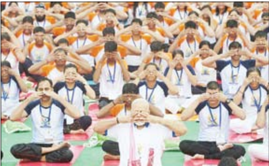
نارنذا مودی نخست وزیر هند (وسط) در روز جهانی بوکا