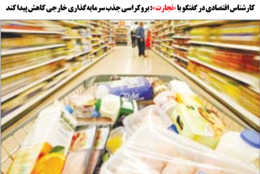
کارکنانی انحصاری در گفتگو با تجارت: پروگراسی جذب سرمایه‌گذاری خارجی کاهش پیدا کند