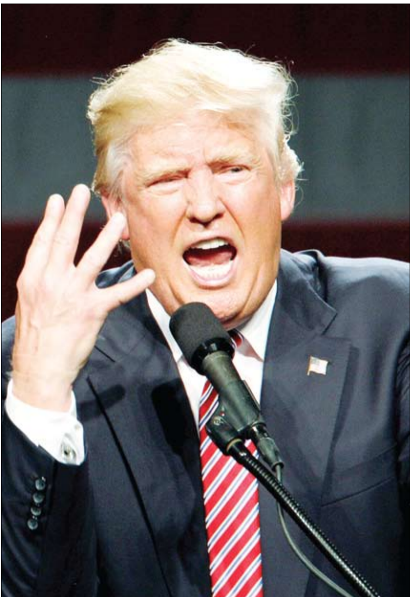
لحن تهدیدآمیز کاخ سفید برای آزادی جاسوسان آمریکایی؛