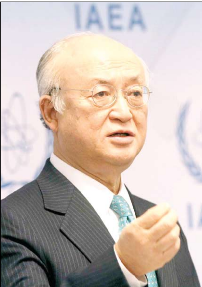
در نشست فصلی شورای حکام آژانس صوت گرفت؛

این بانک همواره در عرصه‌های مختلف اقتصادی کشور حضور داشته است. در سال‌های بعد از جنگ، بانک ملی ایران نقش مهمی در بازسازی آثار بر جا