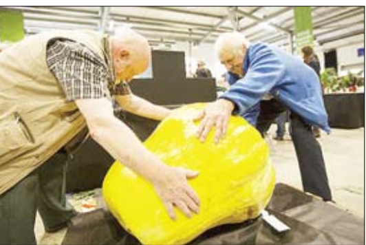
مسابقات سالانه انتخاب برترین میوه و صیفی جات غول اسا در بونرکنامبر بریتانیا