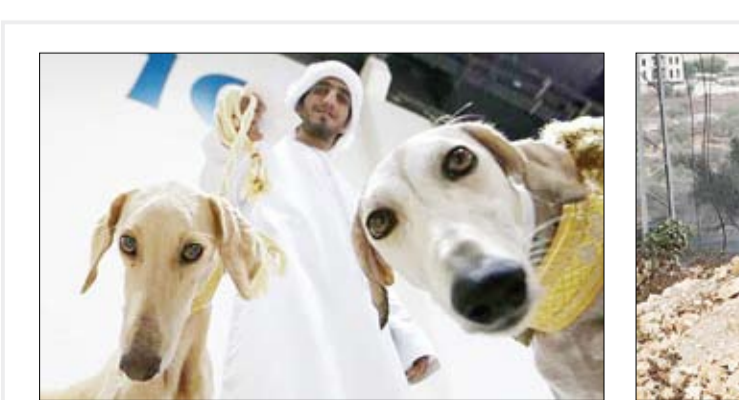
نمایشگاه بین المللی شکار در ابوظبی

معیشت آنها را دچار تنزل کند. محمد بن سلمان از رقیب خود یعنی محمد بن نایف‌رهای یافت تا وارث تخت پادشاهی پدرش شود. در حالی که گمانه‌زنی‌هایی در مورد امکان کنار کشیدن سلمان بن عبدالعزیز از قدرت به نفع پسر مطرح است، بسیاری از عربستانی‌ها و ناظران خارجی بر این باورند که موج بازداشت‌ها ممکن است تلاشی برای هموار کردن راه در مقابل به قدرت رسیدن محمد بن سلمان باشد.