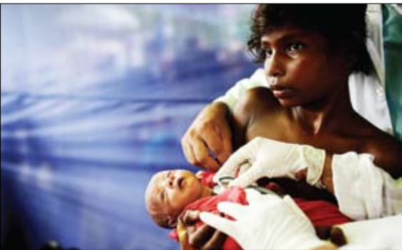
بزکش بنگلادشی در حال معاینه نوزاد ده ماه روهیگابیی

فرودگاه‌های زیان ده به شهرداری‌ها واگذار می‌شوند/ تجارت/ علی کاشی