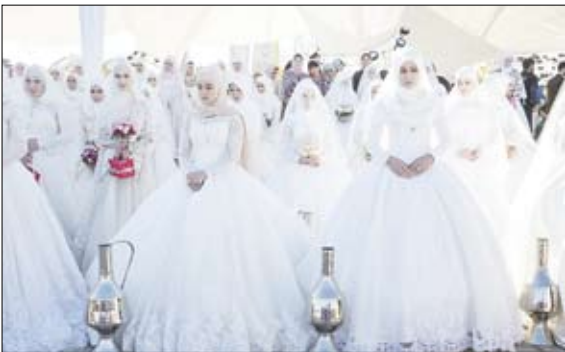
حضور ۱۹۹ عروس در بارک سونجی در صدف بونهمین سالگرد تولد شهرگرنزی