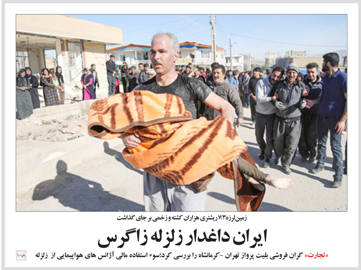
زمین لرزه ۷٫۳ ریشتری هزاران کشته و زخمی بر جای گذاشت

گروه اقتصاد کلان - ایلیا پیرولی: هر روز در اقتصادی که هیچ چیز آن در جای خود قرار ندارد، خبرهای گوناگونی منتشر می‌شود، روزی از راهاندازی بورس ارز خبر می‌دهند، روزی دیگر از تقویت بازار سرمایه در جهت رونق اقتصادی خبرهای را در این باره منتشر می‌کنند و روزی دیگر... اما حالا حرف از ارزهای دیجیتال یا همان بیت کوین است. موضوعی که با وکنش تند کارشناسان بورس و حتی مسئولان بانک مرکزی مواجه شده است.