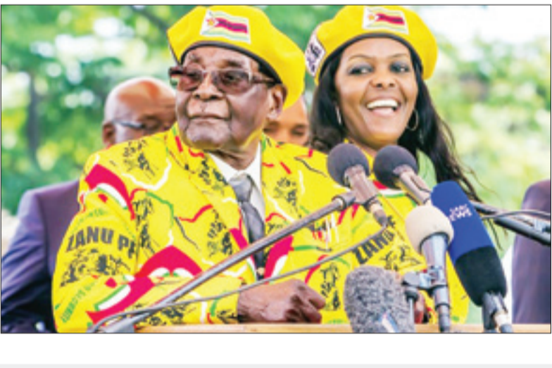
نقاشی‌های معروف روی ساختمان‌های مرسین ترکیه

وامنیت آنها تضمین شده است. یک منبع دولتی نیز از دستگیری وزیر دارایی توسط ارتش به منظور ریشه‌کنی جانیگانان اطراف طی پیامهای توئیتری که امروز منتشر شد ادعاهای مطرح شده در خصوص کودتای ارتش را تکذیب کرد.