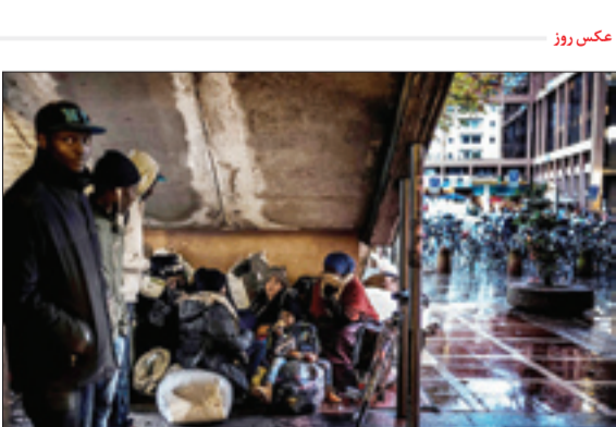
پناهجویان در انتظار استتارر کمپ در لیون فرانسه