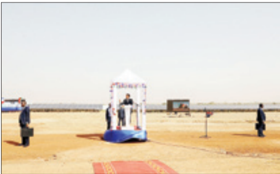
سخنرانی ام‌نول مک‌کرون در افتتاحیه نیروگاه خورشیدی در بورتو کینفاسو – روتترز

تب ۴۰ در اه ای بازار مسکن در هوای سرد پاییزی تجارت/علی کاشی