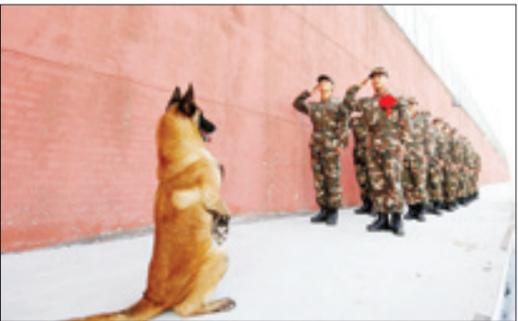
سگ ارتشی چین در کنار رژه سربازان