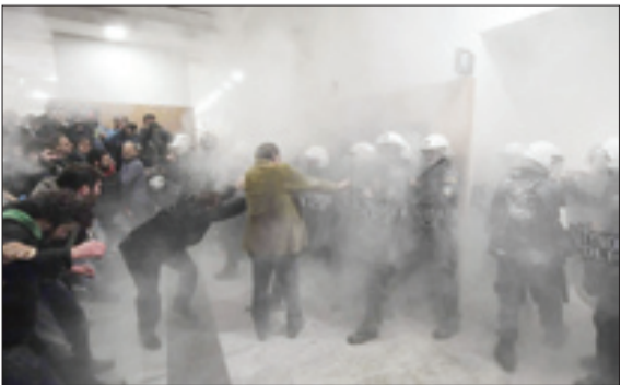
درگیری معترضان یونانی با پلیس ضدشورش در آتن