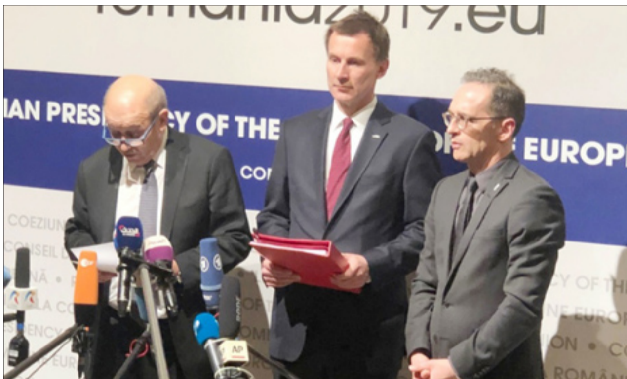
تودهنی دیر هنگام اروپا به آمریکا؛