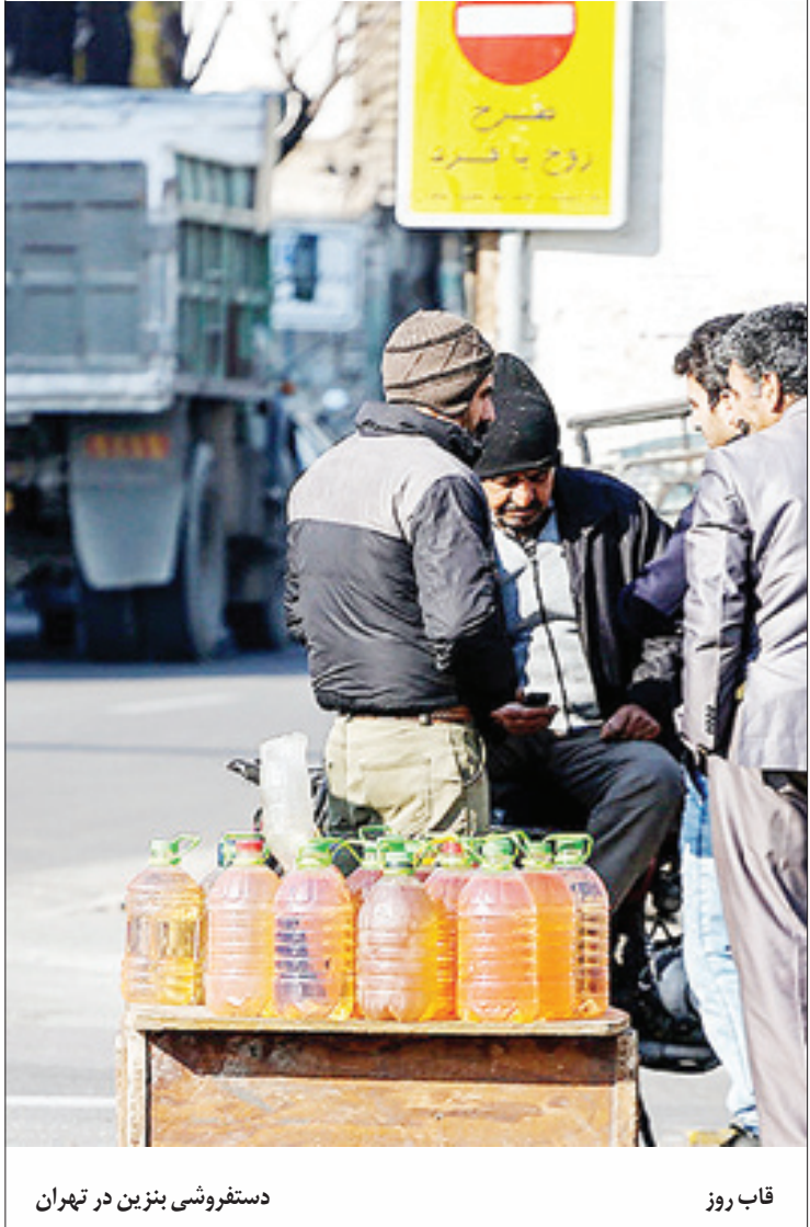
دستفروشی بنزین در تهران

باین حساب تیم ملی کشورمان در صورت غلبه بر ژاپن در نیمه‌نهایی باید با یکی از تیم‌های استرالیا و یا کره جنوبی دیدار فینال را برگزار کند و این مسیر برای ایران در ۴۲ سال گذشته مسدود بوده است و این بار هواداران فوتبال امیدوارند نتوانیم قهرمان جام ملت‌های آسیا شویم.