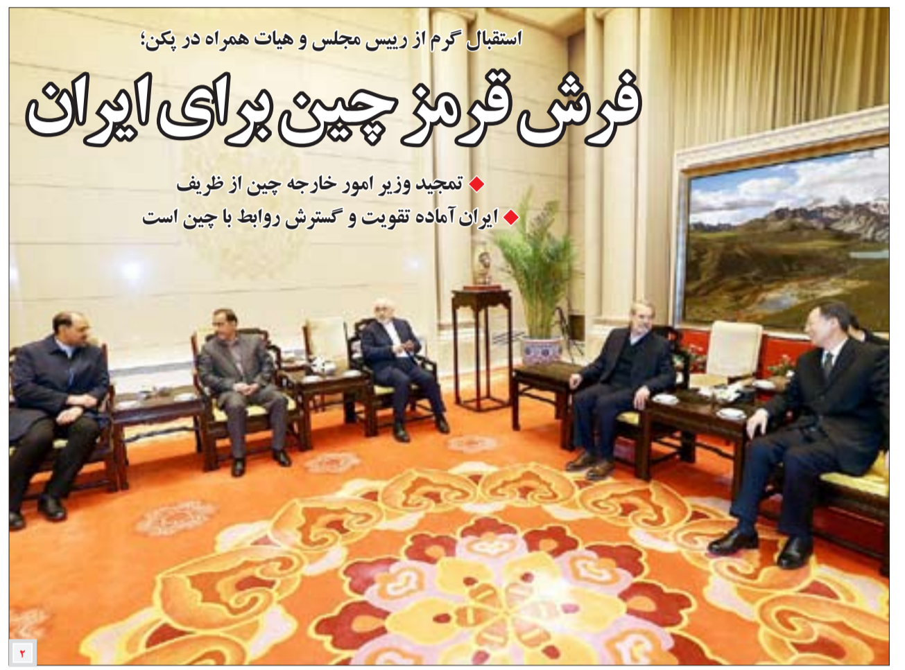
استقبال گرم از رئیس مجلس و هیات همراه در بکن؛