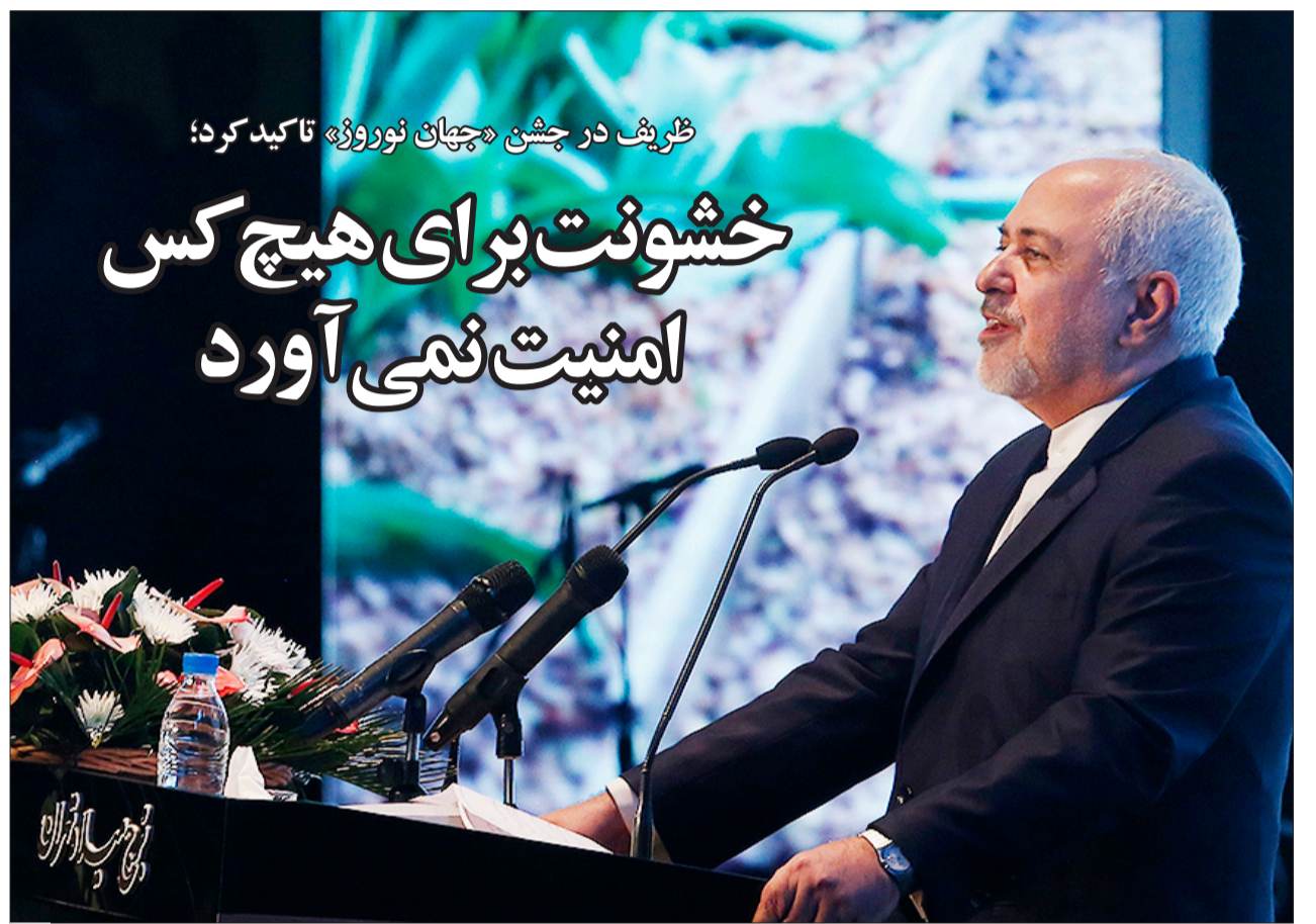
ظریف در جشن «چهار نوروژ» تاکید کرد؛