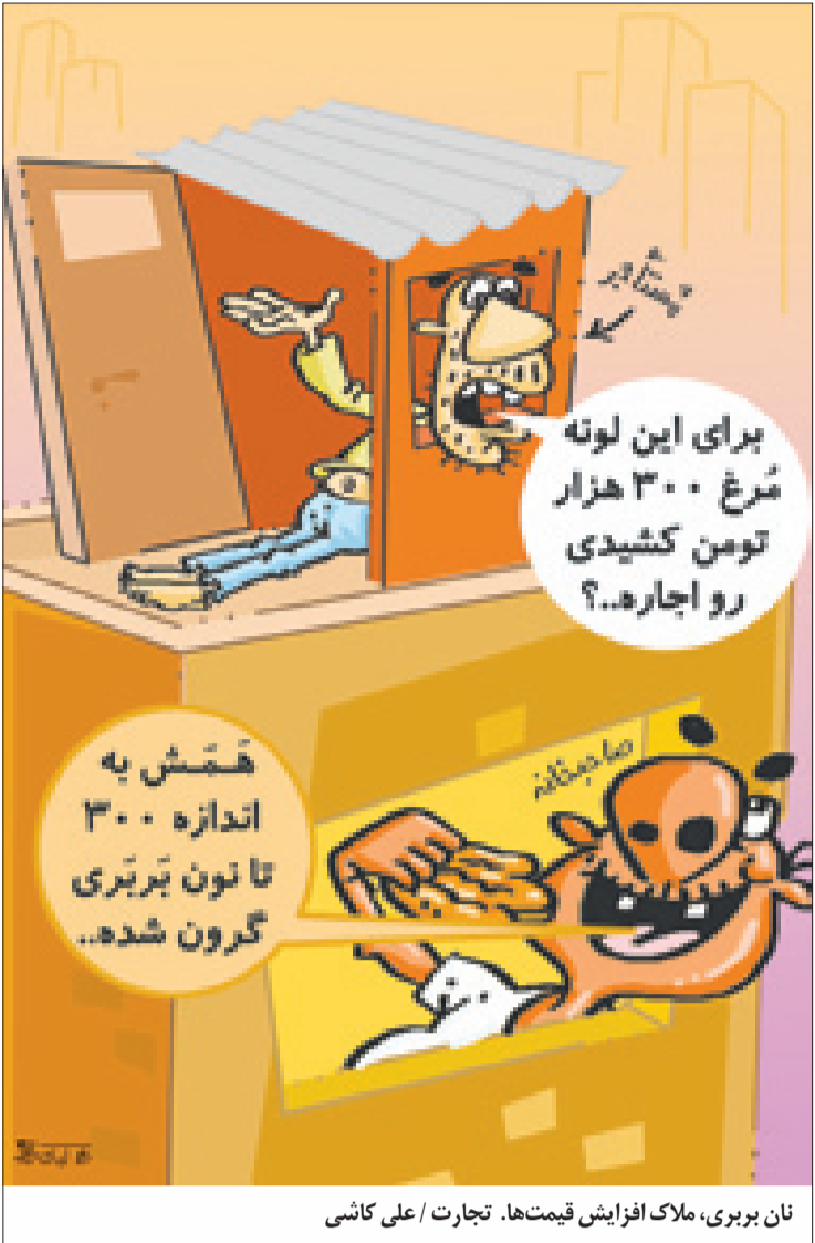
نان بربری، ملاک افزایش قیمت‌ها. تجارت / علی کاشی

صاحب امتیاز: موسسه افروزانه پویا هیئت تحریریه: اقتصاد کلان؛ الیا پورلی، سیاسی؛ کورش شرفشاهی، بانک و بیمه؛ علیرضا ملاحتی، صنعت و مسکن؛ سعید لقیچ، بورس و انرژی؛ مجتبی آزادیان شهرستان‌ها؛ داوود نوریان و ادب فنی: مدیر فنی: امیر شریف، صفحه‌آرایی: علی جواهری نید، محمدسعید رضایی تلفن تحریریه: ۶۶۳۲۵۷۴۶-۶۶۳۱۱۱۷۲ تلفن سازمان آگهی‌ها: ۶۶۳۲۵۷۴۵ آدرس: ستارخان، بین توحید و باقرخان، کوچه اکبریان آذر، پلاک ۵۷ طبقه سوم شرقی تجارت آنلاین: www.tejaratonline.ir | tejarateditor@gmail.com | tejaratnewspaper@gmail.com مدیرمسئول: اصغر نعمتی مدیر تحریریه: کورش شرفشاهی، بانک و بیمه؛ علیرضا ملاحتی، صنعت و مسکن؛ سعید لقیچ، بورس و انرژی؛ مجتبی آزادیان شهرستان‌ها؛ داوود نوریان و ادب فنی: مدیر فنی: امیر شریف، صفحه‌آرایی: علی جواهری نید، محمدسعید رضایی تلفن تحریریه: ۶۶۳۲۵۷۴۶-۶۶۳۱۱۱۷۲ تلفن سازمان آگهی‌ها: ۶۶۳۲۵۷۴۵ آدرس: ستارخان، بین توحید و باقرخان، کوچه اکبریان آذر، پلاک ۵۷ طبقه سوم شرقی