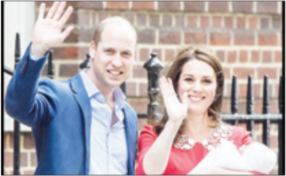
مرخص شدن همسر نوبلکه بریتیا ریاستان پس از ایمان