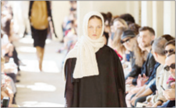
هفته مد در سانتواتولو بریزل

زندگی شما وقتی که رئیس‌تان، دوستانتان، والدینتان، شریک زندگی‌تان یا محل کار تان تغییر می‌کند، دست‌خوش تغییر نمی‌شود. زندگی شما فقط وقتی دگرش می‌یابد که شما تغییر کنید، باورهای محدود کننده % خود را کنار بگذارید و باور کنید که شما تنها کسی هستید که مسئول زندگی خودتان می‌باشید. مهم‌ترین رابطه‌ای که در زندگی می‌توانید داشته باشید، رابطه با خودتان است. خودتان را امتحان کنید. مواظب خودتان باشید. از مشکلات، غیرممکن‌ها و چیزهای نا در دست‌داده نهراسید. خودتان و واقعیت‌های زندگی خودتان را بسازید.