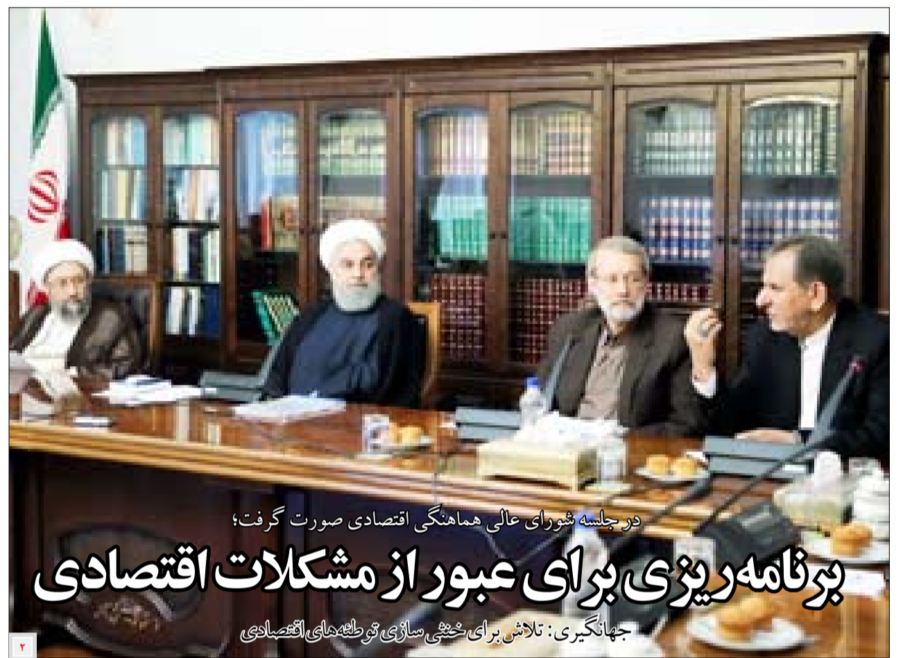
در جلسه شورای عالی هماهنگی اقتصادی صورت گرفت؛

طی چند روز گذشته تالار شیشه های شاهد وضعیت بی سابقه ای در حوزه بازار سرمایه و موجب رکوردشکنی های بی در پی در بورس بود. هر چند بورس با راهبانی آشنای آمیخته به شگفتی به استقبال تغییرات رو به رشد بازار سرمایه رفته اند در عین حال برخی کارشناسان با این حجم از رکوردشکنی ها در این بازار با دیده احتیاط دنبال می کنند. البته چنانچه این اتفاق باعث رونق پایدار در حوزه بورس باشد که باید آن را به فال نیک گرفت و به پیشواز آن رفت، و گرنه چنانچه وضعیت اخیر این حوزه