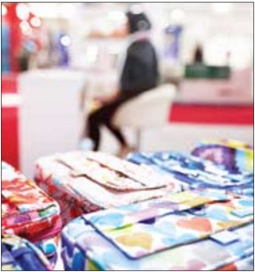
پنجمین نمایشگاه بین المللی نوشت افزار. شهر اصفاب