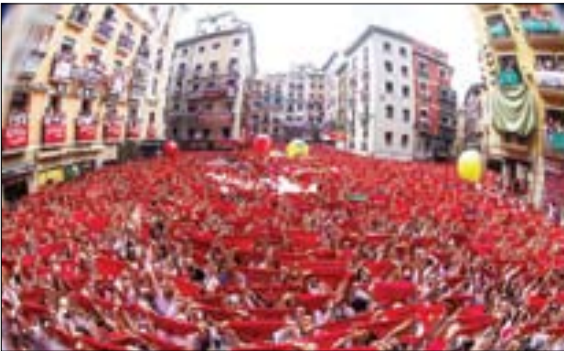
جشنواره سالانه سان فرمین در شهر پامپلونا، شمال اسپانیا

راه‌پله‌های بزرگ، اتاق‌های با کاغذپیواری‌های طلایی و شومینه در هر اتاق هزینه‌های بسیاری به شرکت تحمیل می‌کرد. بنابراین، شرکت راه‌آهن میدلند و اسکاتلند در سال ۱۹۳۵ هتل را تعطیل کرد تا در هزینه‌های نگهداری آن صرفه‌جویی کند. پس از تعطیلی، ساختمان که تا آن زمان گراند هتل میدلند نام داشت به تالارهای سنت بانکراس تغییر نام داد و به عنوان اداره راه‌آهن بریتانیا مورد استفاده قرار گرفت. راه‌آهن بریتانیا امیدوار بود به‌زودی این سازه عظیم را تخریب کند اما به دلیل کمپینی که از سوی انجمن ویکتوریان، سازمان حافظان تاریخ راه‌آنها در این ساختمان تخریب‌نشده و در سال ۱۹۶۷ هتل و ایستگاه راه‌آهن سنت بانکراس در طبقه‌بندی بناهای فهرست‌شده انگلستان از نظر تاریخی و اهمیت رتبه «درجه ۱» را دریافت کرد. در دهه ۹۰ میلادی نمای بیرونی این ساختمان با هزینه حدود ۱۰ میلیون پوند مرمت و در سال ۲۰۰۴ طرحی برای تبدیل مجدد آن به هتل ارائه شد. در طراحی جدید این هتل، از فرش‌ها و گلیم‌های طرح ایرانی استفاده شده‌است به طوری که پلکان اصلی هتل سنت بانکراس رنسانس لندن پوشیده‌از قالی‌های تشریفات ایرانی است و راهرها و اتاق‌های بال شرقی با گلیم‌ها و فرش‌های طرح کاشان و تبریز آراسته شده است.