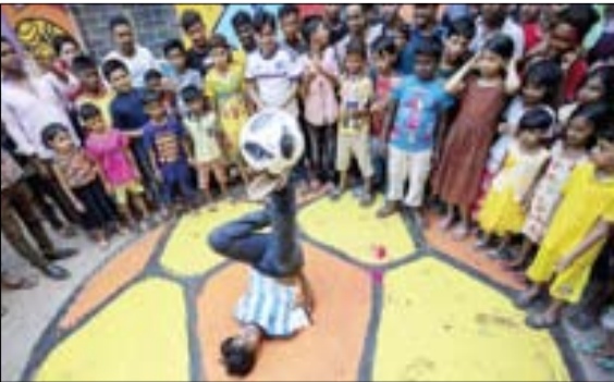
نمایش خیابانی به مناسبت جام جهانی ۲۰۱۸ فوتبال. داکا بنگلادش