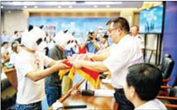
مراسم سالانه اعطای جایزه به خیر چنان بیلس بابت کشف جرایم، گوانگژو چین