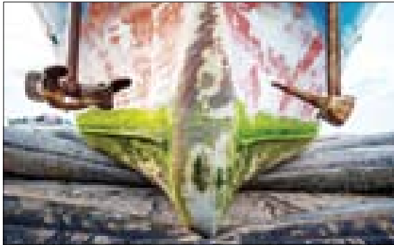
کارخانه کشتی‌سازی در بندر اتلی