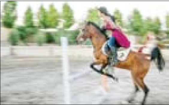
نخستین «اسبورا» انجمن نژادی اسب کرد در کرمانشاه