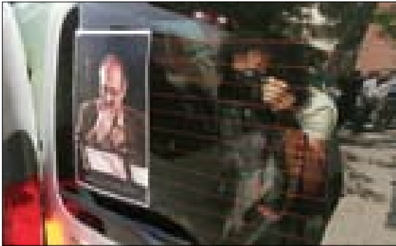
تشییع پیکر صدراالدین شجره