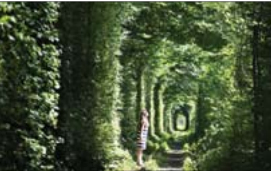
مسیر راه اهن قدیمی مشهور به تونل عشق، اوکراین

وی ادامه داد: سال گذشته تولید پسته در کشور حدود ۲۸۰ هزار تن بوده که امسال این عدد حدود ۲۰۰ هزار تن پیش‌بینی می‌شود و هم سرمازدگی و هم گرم‌زدگی، بخش زیادی از محصول ما را دچار آسیب کرده است. کاهش درآمد باغداران حاجی‌وند افزود: این حادثه درآمد باغدار را دستخوش تغییرات کاهشیه کرده است که به کمک نهادهای حمایتی و پشتیبانی