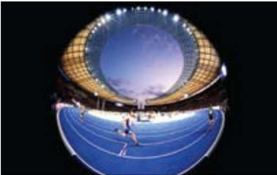
مسابقات دویدانی قهرمانی اروپا