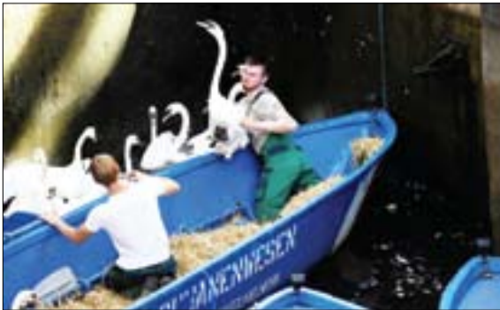
سرشماری قوها قبل از مهاجرت، هامبورگ