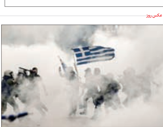
اعتراض یونانی به تغییر نام مقنونه. یونان