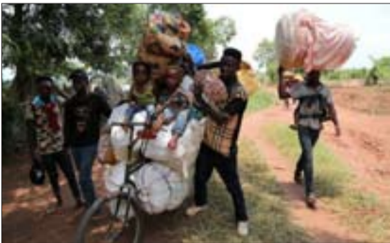
اخراج مهاجران کنگویی، اتنگولا

این در حالی است که تعیین منابع در آمدی و هزینه‌ای تا حدی وابسته به پیش‌بینی‌های مربوط به درآمدهای نفتی، نرخ دلار به عنوان مبنای تبدیل ارز به ریال و همچنین در مهمترین آنها تعیین سقف حقوقی کارکنان و میزان افزایش آن در سال آینده است که هنوز در این رابطه به جمع‌بندی نهایی نرسیده‌اند.