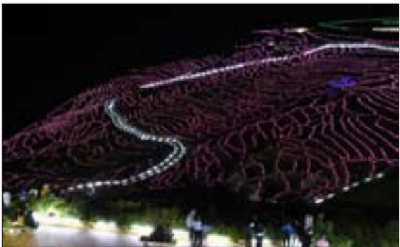
نودبرازی شالیزار، ژاپن