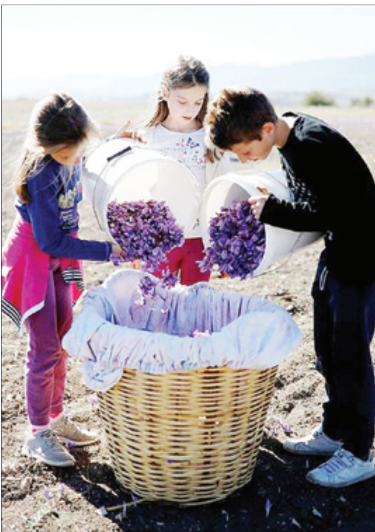
چیدن زعفران در یونان