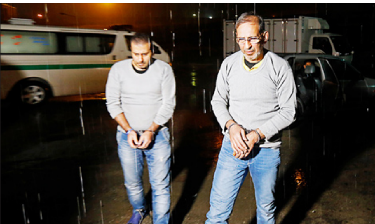
سلطان سکه و همدستش اعدام شدند؛