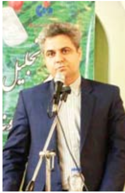
بسیجیان برتر شرکت به رسم یادبود هدایایی اعطا شد.

درصد رشد داشته‌ایم. مدیر عامل بیمه دانا افزود: این آمار نشان می‌دهد بیمه دانا که رشد مطلوبی در حوزه فروش دو ماهه به ثبت رسانده، با تقویت شاخص‌های عملکردی خود به سمت تحقق اهداف از پیش تعیین شده حرکت می‌کند و امیدواریم تا پایان سال جاری با همت و تلاش مضاعف و روحیه بسیجی همکاران به رشد و پیشرفت مورد نظر دست پیدا کنیم. گفتنی است: در پایان مراسم به