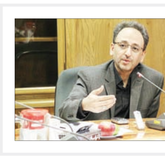
کاهش ۲ برابری هزینه‌ها افزایش ۲ برابری نرخ ارز را جبران کرده است

وی درباره افزایش قیمت خرید تضمینی برق اظهار داشت: آنچه منتساجهانی دارد و در سال ۹۵ وزارت نیرو طراحی و ابلاغ کرده است حدود ۲٫۵ برابر هزینه‌ها در سطح جهان یافته است اگر در سال ۹۵ یک واحد نیروگاه خورشیدی ۱۳۰۰ یورو سرمایه‌گذاری خارجی لازم داشت این رقم امروز به ۶۰۰ تا ۷۰۰ یورو کاهش یافته است. البته در سال ۹۵ سهم استفاده از تجهیزات خارجی زیاد بود امروز خوه‌مان خط تولید ۷۰ تا ۸۰ درصد فناوری‌ها را داریم به طوری که سال گذشته ۱۳۰ مگاوات در شیراز و علاوه بر این چهار خط تولید هم به بهره‌برداری رسیده بنابراین هزینه‌ها کاهش می‌یابد اگر چه با افزایش نرخ ارز و هزینه‌های سرمایه‌گذاری مواجه بودیم، مثلا اگر نرخ ارز سه برابر شده کاهش دو برابری هزینه‌های سرمایه‌گذاری آن را جبران کرده و سرمایه‌گذاران ۳۰ تا ۴۰ درصد افزایش سرمایه‌گذاری داشته‌اند.