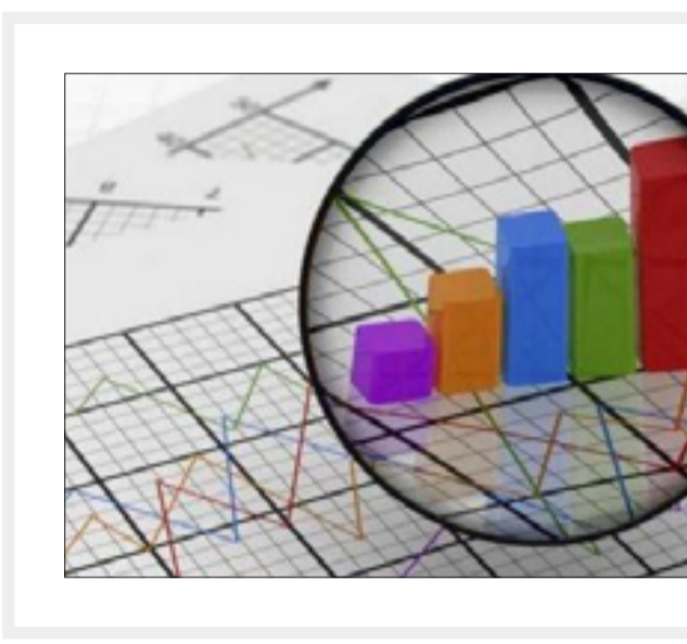
تحلیل بعضی از کارخانه‌جات از این قبل است.

بیش از ۱۰ دستورالعمل برای معادلات اقتصادی صادر می‌کند، گفت: به‌عنوان نمونه در صنعت قیر دو دستورالعمل طی یک ماه صادر شد که در تضاد با یکدیگر بودند و در این میان سهامداران و صاحبان صنایع قیرسازی ضررهای هنگفتی کردند و در نهایت این دستورالعمل‌ها حذف شدند. وی افزود: کاذبکاری و تصمیم‌های خلق‌الساعه موجب می‌شود افرادی که قصد سرمایه‌گذاری در بخش تولید را دارند ن‌توانند قید این کار را زده و در نهایت به سمت بازارهای غیرمولد مانند بازار ارز و طلا بروند و تولید را تحت‌الشعاع مباحث دلالی قرار دهند.