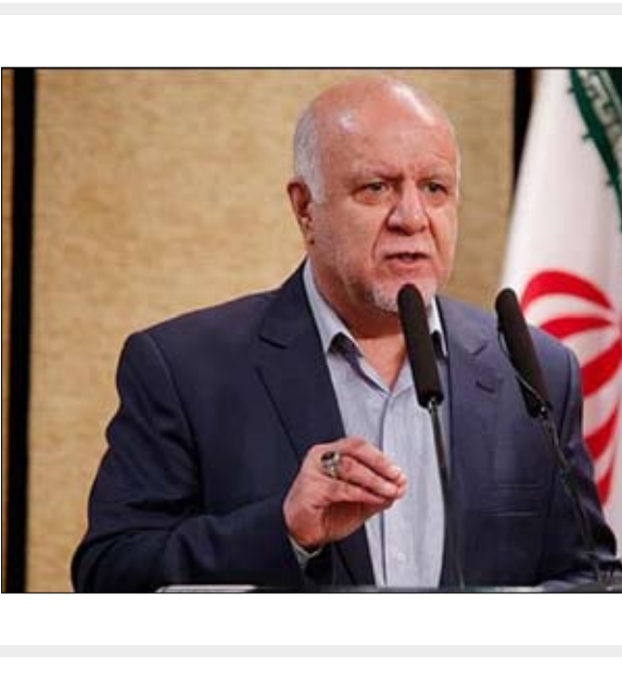
وزیر نفت، هاشم‌زاده فرهنگ

کرد و دولت هم ان شاء… با توان خود خسارت‌های وارده به مردم را جبران می‌کند. وزیر نفت تأکید کرد: ملت ایران اکنون در رنج هستند برای اینکه بخشی از ایران که خوزستان است در رنج است و همه ما باید کمک کنیم تا این رنج از دوش مردم خوزستان برداشته شود. زنگنه با اشاره به اقدام‌های عناصر ضد انقلاب و دشمنان وحدت و یکپارچگی ملت ایران، در این باره توضیح داد: طرح مواردی از این دست که صنعت نفت یا مسئولان استان خوزستان قبول