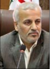
وزیر نیرو، هاشم‌زاده فرهنگ