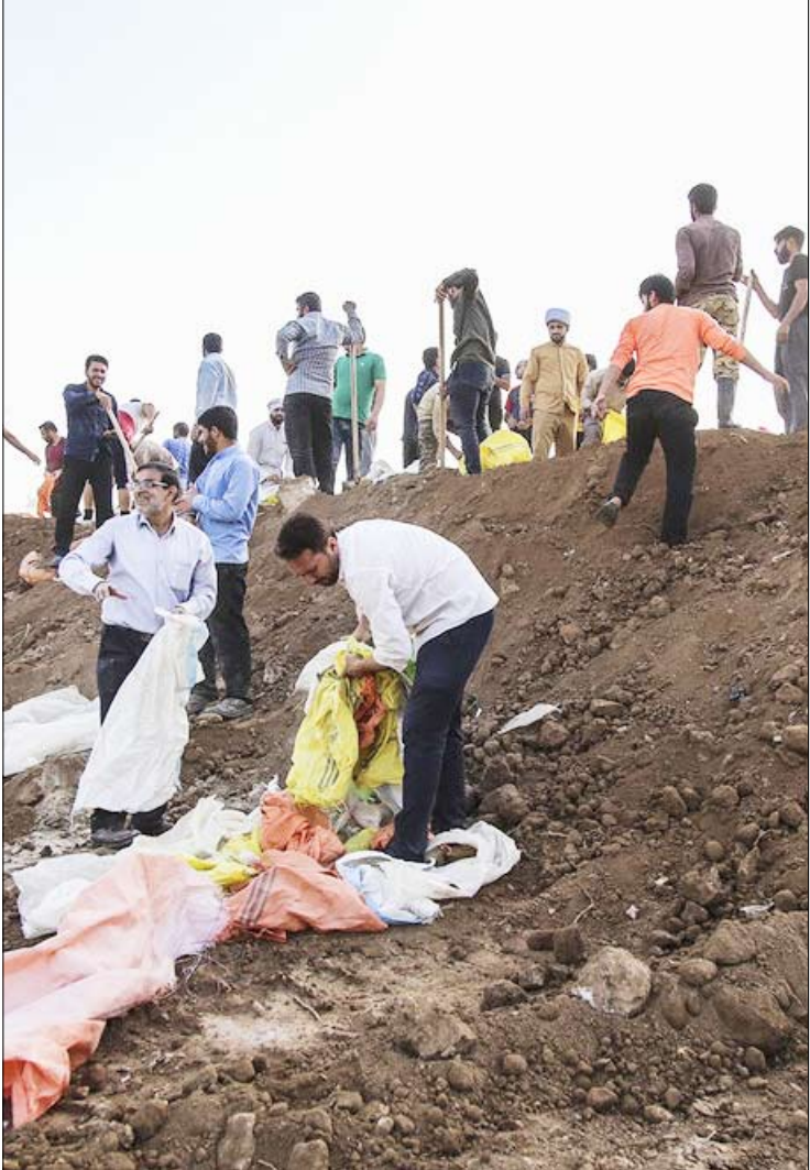
قاب روز – بسج عمومی برای مقابله با سیل خوزستان – مهر

…ماجرا نگرند منتقلن دولت کاستی‌های عملکرد دولت در این اتفاق ونودامکانات ومدیریت ضعیف مسئولان را برجسته کرده‌و متأسفانه در تالاشنداز این حادثه به‌عنوان یک فرصت برای حمله به دولت استفاده کنند.موافقان وو متحذلن دولت روحانی هم با انعکاس سفر مسئولان و به تصویر کشیدن کمک‌های دولت و انتشار انواع عکس هاو فیلم‌ها از پخش نان و غذا گرفته تا حضور تا کمر مسئولان در آب و ترک‌های زمین و … تلاش می‌کنند دولت را در میانه میدان و در حال کمک به سیل زدگان معرفی کنند. در میانه این رقابت رسانه‌ای اما وضعیت سیل زدگان روز به روز دارد بترنج تر می‌شود. بیماری، درماندگی، ترس از آینده، بی‌بناهی و انواع بحران‌های پس از حادثه در میان سیل زدگان را اما هیچ دوربین با کیفیت و فیلم خبری و تبلیغاتی و انتشار عملکرد دولت و نهادهای غیر دولتی نمی‌تواند به تمامی و کامل پوشش دهد. در این میان اما گاه آدمی لحظاتی را مشاهده می‌کند که چوهر و چهره واقعی ما ایرانی‌ها و روانی بدون سانسور و واقعی از روز گیل سیل زدگان را نشان می‌دهد. برای درک واقعی ماجرا شاید کافیتست این پار که به انبوه فیلم‌ها و عکس‌ها و خبرهای مناطق سیل زده نگاه کردید عینک حزبی و اصلاح طلبی و اصولگرایی خود را از چشم‌ها بردارید و در فیلم‌های بی‌کیفیتی که با دوربین‌های موبایلی ساده