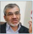
سید حسن نقوی

انتخابات مجلس شورای اسلامی در این شورا گفته:براساس برنامه‌ریزی‌های انجام‌شده بررسی مصوبه مجلس درباره اصلاح موادی از قانون انتخابات مجلس در شورای نگهبان آغاز شد. وی با بیان اینکه در این شورا سعی می‌کنیم در مهلت مقرر قانونی نظر خود را نسبت به استانی شدن انتخابات مجلس اعلام کنیم؛ اظهار داشت: روند بررسی این طرح در شورای نگهبان آغاز می‌شود. سخنگوی شورای نگهبان در پایان خاطر نشان کرد: هنوز مشخص نیست زمان رسیدگی به طرح اصلاح موادی از قانون انتخابات چه زمانی در شورای نگهبان پایان می‌یابد، اما به‌طور قطع پیش از موعد مقرر قانونی ۲۰ روزه خواهد بود.